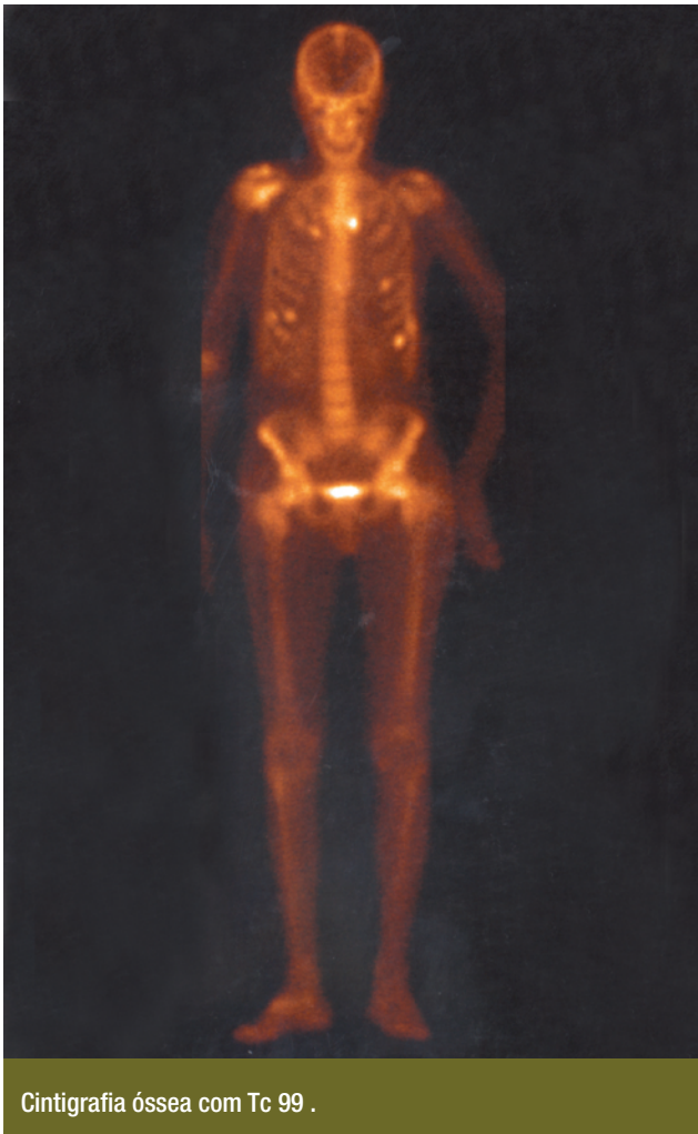
Cintigrafia óssea com Tc 99 .